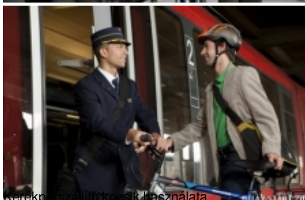
Kerékpárszállító koszik használata