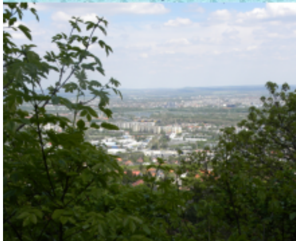
Mindent egybevetve nagyszerű kis túra volt az elejétől a végéig.