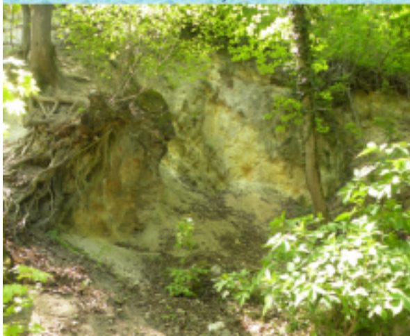
innen származó dolomitport sárolószerként használták a háztartásokban.