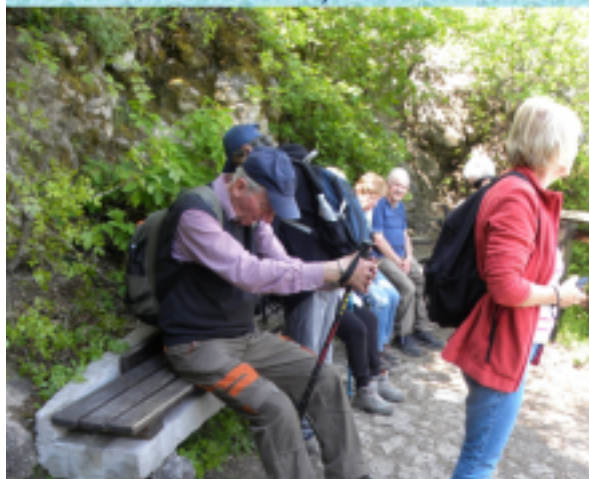
Pihenő a túra vége felé.