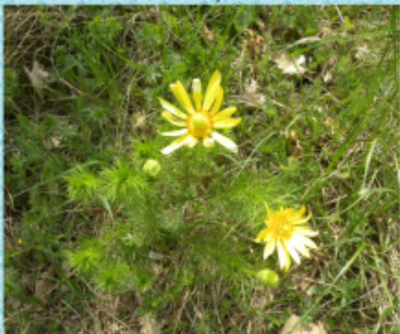
Már nyílik a Tavaszihérics.