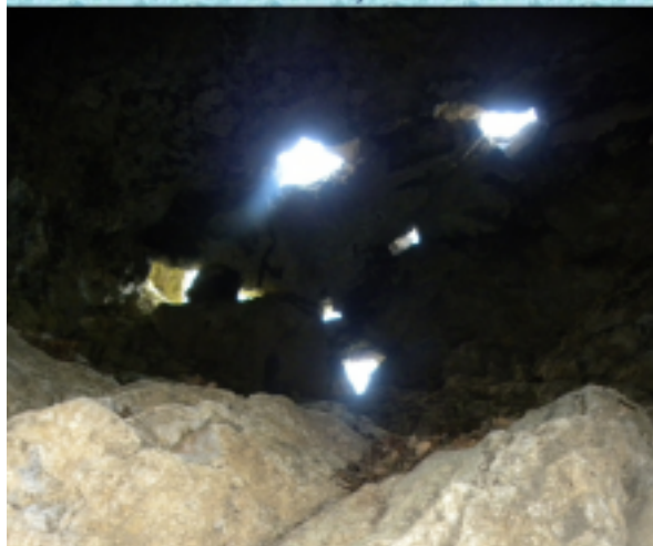
A barlang mennyezetete beszakadozott.