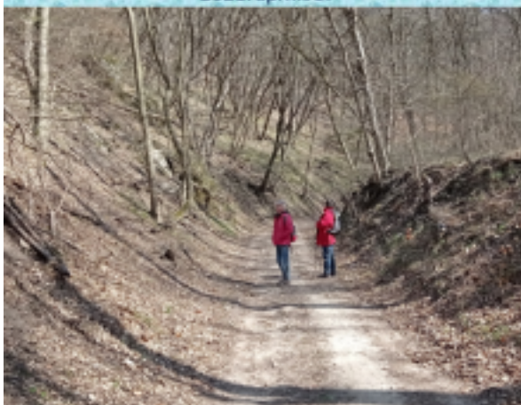
Nagykovácsi – Ilona-lak 2021. április 5.