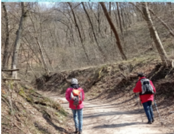
Nagykovácsi – Ilona-lak 2021. április 5.