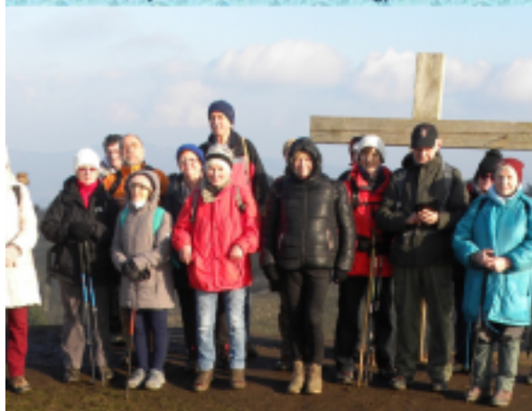
Túránk csúcspontján, a Nagy Szénáson (550 m).