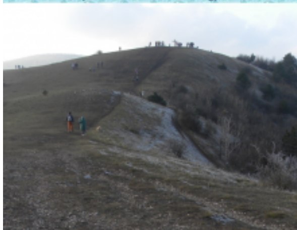
A Budai hegység egyik legszebb kilátást nyújtó hegye, a kopár és kerek kúpokból álló Nagy Szénás (550 m).