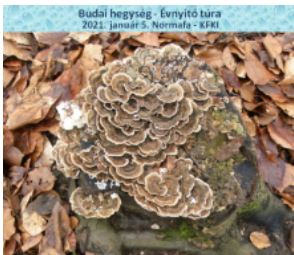
Budai hegység - Évnyitó túra 2021. január 5. Normafa - KFKI

nyvet elhagyva, tovább lépkedve az erdőben, felfedeztünk egy lepkeaplant, amely nagy telepekben tenyészik, gyakori gombafaj.