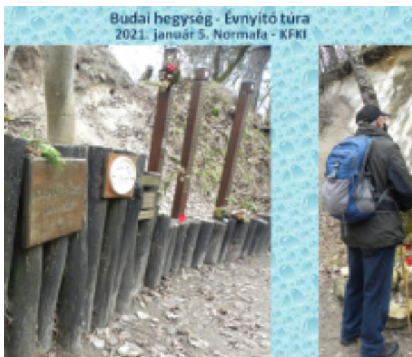
Budai hegység - Évnyitó túra 2021. január 5. Normafa - KFKI

Idén évente szervezünk kegyeleti emléket a halottak napját követő első szombatra, hogy méltóképpen emlékezzünk elhunyt túristákra.