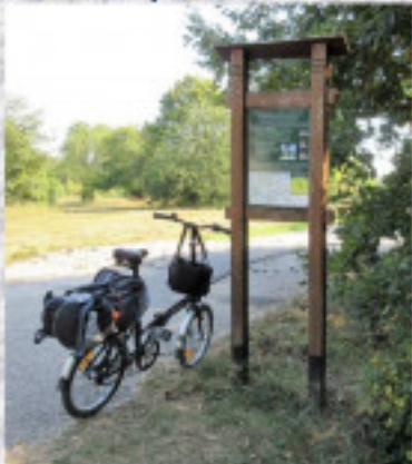
14-én, az utolsó nap délutánján.