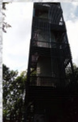
... és még pár fotó a túráról.