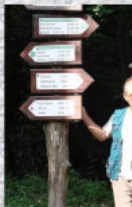
... és még pár fotó a túráról.